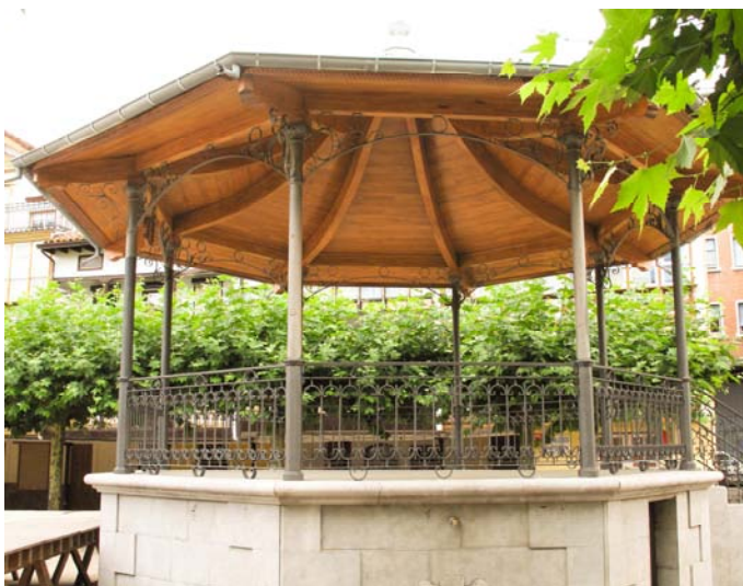
Structure en chêne lamellé collé Panneaux isolants Sapolis® avec sous-face chêne Kiosque - Espagne

Nous travaillons régulièrement des bois performants comme l'épicéa ou le pin mais pour des ouvrages plus prestigieux nous sélectionnons des essences nobles telles que le chêne, le hêtre, le frêne, le châtaignier ou le red cedar.