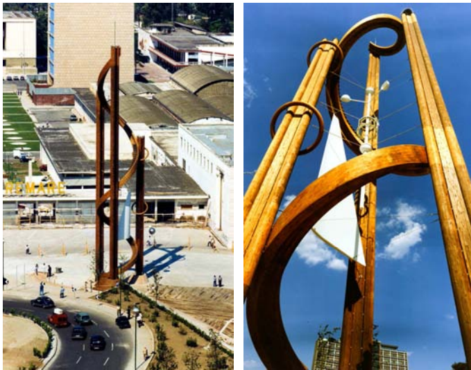
Tour du Temps Structure en Mélèze - hauteur 35 m - Naples (Italie)

Nous concevons et réalisons des projets complexes nécessitant savoir-faire et haute technicité. L'innovant système d'assemblage Résix® en est la preuve.